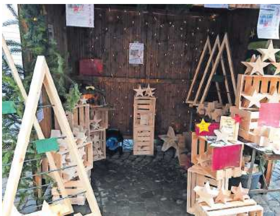
2100 Euro zugunsten von „Mama/Papa hat Krebs“ wurden durch den Verkauf von Holzsterne, Christbäume und Kästen erwirtschaftet.

Die Firma stiftete dazu das Material, die Mitarbeiter ihre Arbeitsleistung. jlk